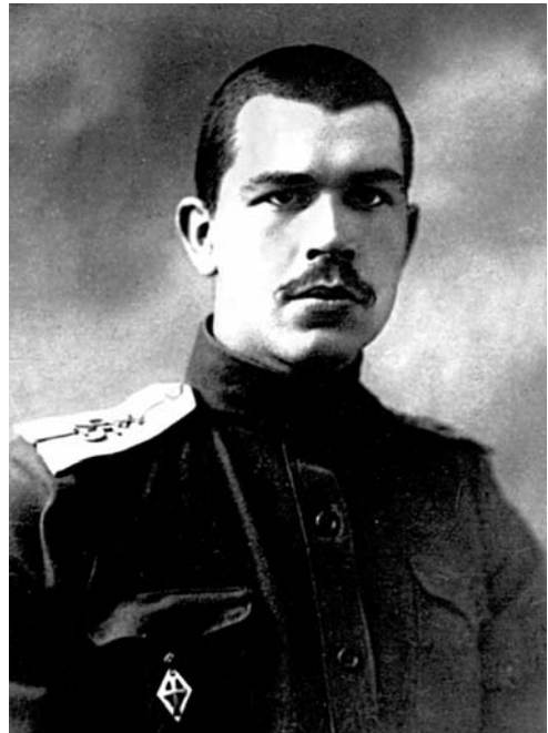
С. И. Вавилов — прапорщик инженерных войск, 1916 г.

Чудовищная весть — немцы предложили мир. Это предложение князю сделаться лакеем. [...]