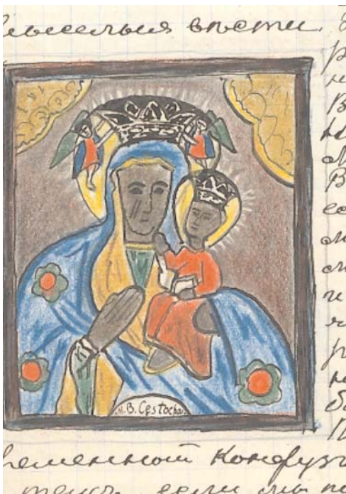
Рисунок иконы (в подлиннике цветной) из дневника С. И. Вавилова 9–10 июля 1915 г.

Унылый год, печальный для меня и для многих, а для мира — роковой. Начал его, дежуря на телеграфной станции в Кельцах, кончаю, строя железнодорожную станцию под Минском. Ничего чрезвычайного не случилось. Основная книга — «Фауст» за весь год, ею начал, ею и кончаю. Физика моя иногда просыпалась, но без успеха. Но на все наложила свою печать несчастная война, каждое движение вызвано ею, она регулятор, а я уж не я, а 1/600000 часть русской армии. Это основная кривая года, а все остальное так, вокруг нее канитель. Кроме того, говорю: понял себя, и понял — потерял в себя веру. Мне нужна особая, тепличная атмосфера, и только тогда не будет вечной пришибленности и тоски. Нет веры в себя, ни в других — вот печальный вывод несчастного года. Конечно, постараюсь передвигаться. [...]