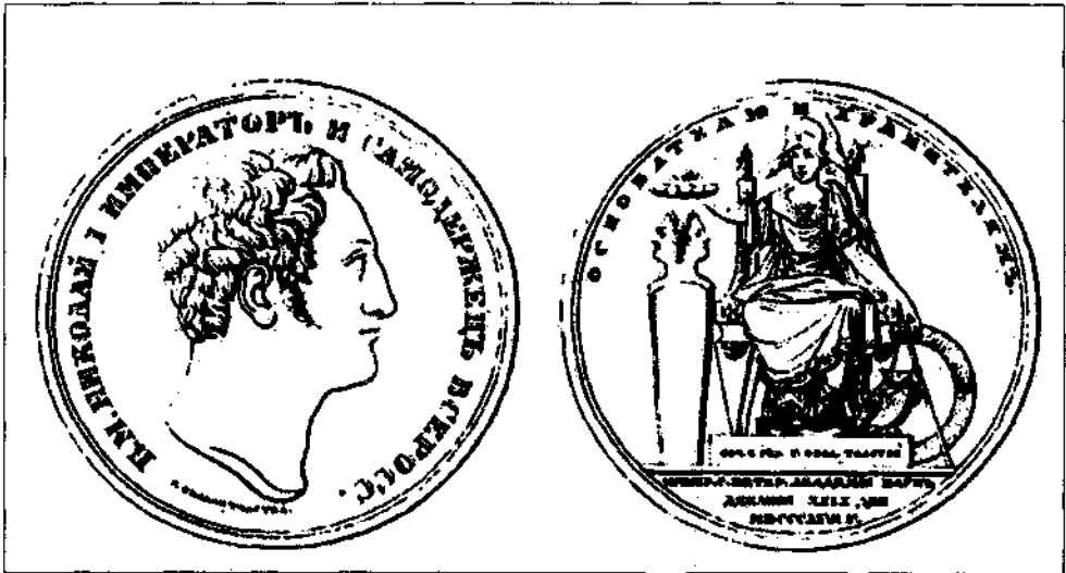
Юбилейная медаль 100-летия Академии наук (1826)

Диплом на звание почетного члена Академии наук, поднесенный Николаю I в ознаменование 100-летия Санкт-Петербургской академии наук