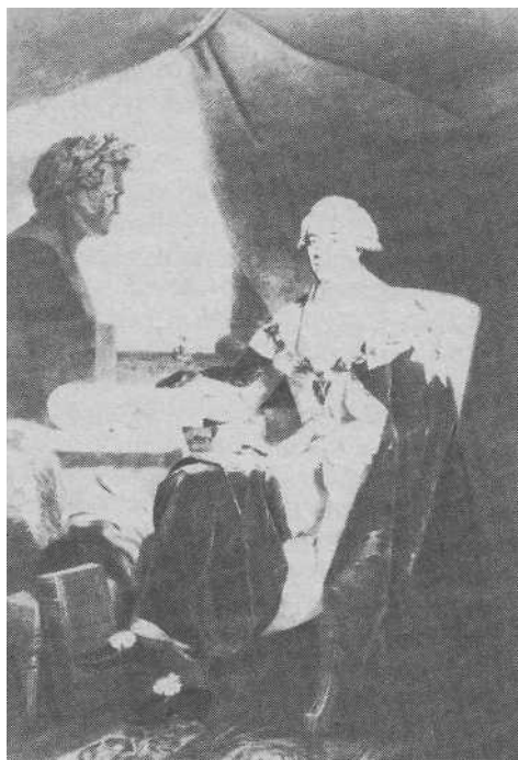
Граф Николай Петрович Румянец (1754—1826)

Затем, в течение почти двух лет граф не мог получить официальной отставки, оставаясь в Петербурге «без всякого значения и без всякой доверенности» со стороны императора [20, с. 133]. Его неоднократные просьбы об увольнении Александр I оставлял без внимания, пока в феврале 1814 г. канцлер сам не устра-