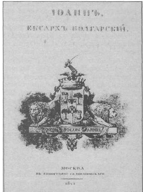
Герб Н. П. Румянцева на титульном листе книги: Иоанн, Ексарх Болгарский. Исследование, объясняющее историю словенского языка и литературы IX и X столетий. Москва, 1824.