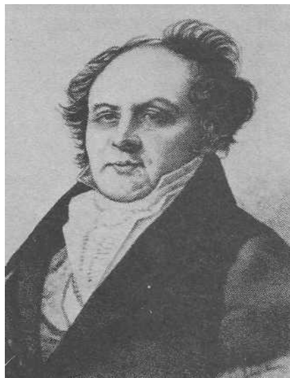
Граф Федор Андреевич Толстой

ческой. Стать обладателем обширного и хорошо подобранного собрания было престижно, так как оно могло доставить его владельцу славу истинного знатока и любителя древностей. Главным соперником канцлера в этом деле оказался граф Федор Андреевич Толстой 1 , уже давно коллекционировавший древнеславянские памятники, — в отличие от Румянцева, который систематически стал приобретать рукописи только с 1817 г. Так, в сохранившемся каталоге русско-славянской части библиотеки канцлера на 1814 год значилось только 33 «рукописных предмета или манускрипта» [14, с. 78]. Благодаря активности и знаниям его сотрудников, коллекция Румянцева быстро пополнялась и скоро уже могла посоперничать с известным собранием, но определить победителя должно было опубликование каталогов.