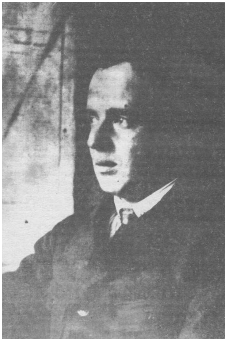
Ф. Г. Добржанский в Ленинграде (1924—25 гг.)